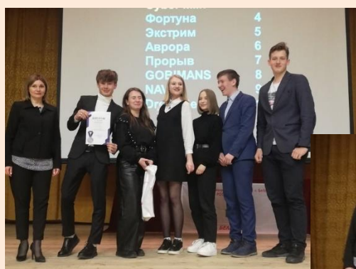
I место СШ 27 «БесСознания»

Борьба была напряжённой. Дважды по результатам тура на первое и второе места претендовали несколько команд. Но в итоге обошлось без дополнительных вопросов и призовые места распределились следующим образом: