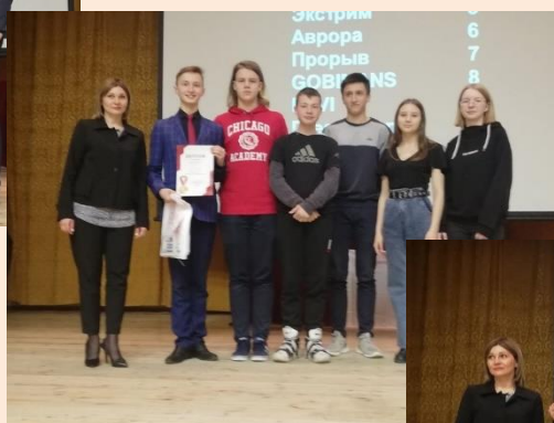
II СШ 31 «Максимум»