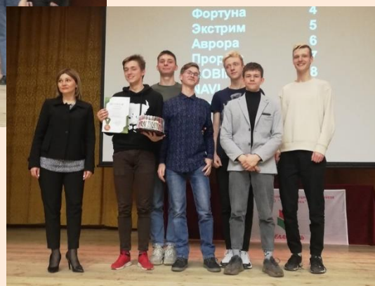
III БГЛК «Cyber Milk».