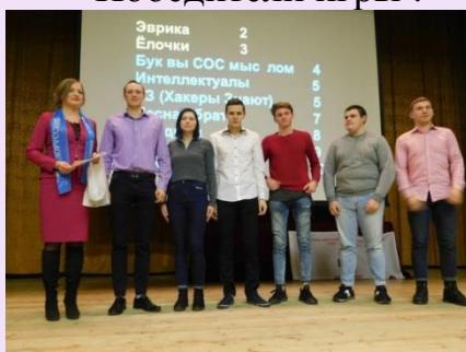
2 место команда «Эврика», гр.ЛХ-41 филиала