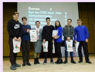
3 место команда «Ёлочки», гр.ЛХ-11 филиала

Администрация филиала и организаторы игры поздравляют ПОБЕДИТЕЛЕЙ и желают им дальнейших успехов в учёбе, в овладении знаниями и постижении ещё неизведанных граней науки .