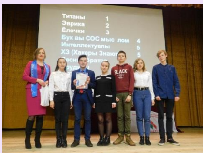
1 место команда «Титаны», СШ №27